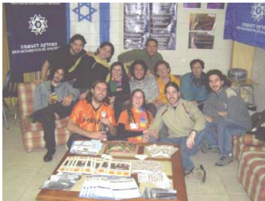
Activistas de Hagshamá con banda "Purple Jrein" de Argentina

Hagshamá Alrededor del Mundo: México Brasil Sudáfrica Australia España Italia Francia Estados Unidos Canadá Chile Argentina Uruguay Venezuela Hungría