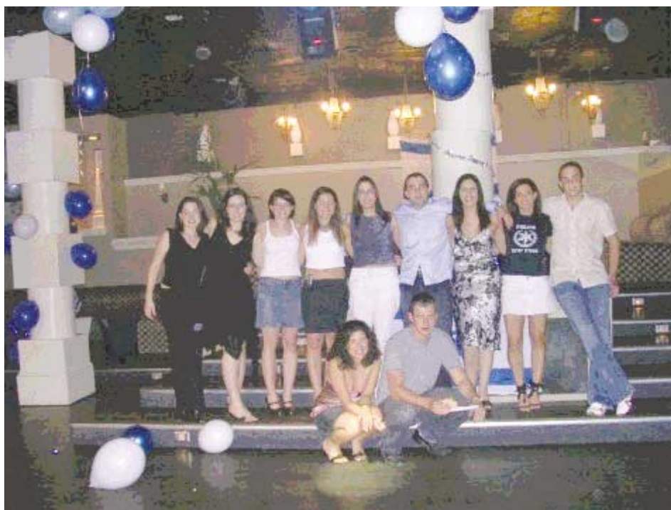
Hagshamá Celebra Yom Ha'atzmaut, USA

Hagshamá Alrededor del Mundo: México Brasil Sudáfrica Australia España Italia Francia Estados Unidos Canadá Chile Argentina Uruguay Venezuela Hungría