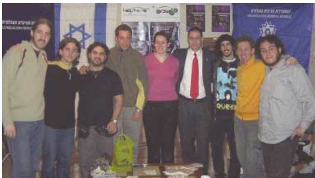
Stand de diplomáticos y Hagshamá, Chile

En muchos países, se desarrollan las actividades propias de Hagshamá , y aquellas que se llevan a cabo con la colaboración de los movimientos de Hagshamá y con otras instituciones del mundo judío.