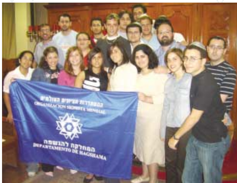
פעילי הגשמה במלגה, ספרד

עם תקציבים מועטים ועם כח אדם מצומצם המחלקה להגשמה הצליחה למצב את עצמה כאחד הגורמים הבולטים והמשמעותיים